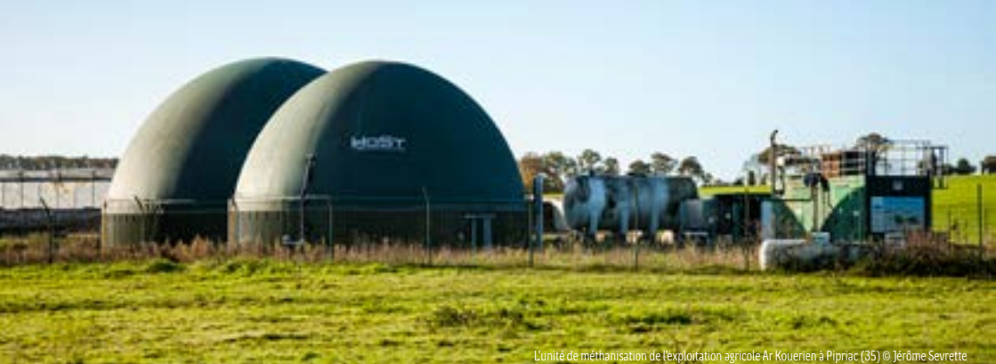
L'unité de méthanisation de l'exploitation agricole Ar Kouerien à Pipriac (35)